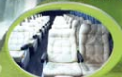
Servicio Semi Cama