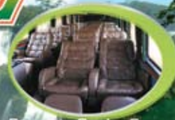
Servicio Coche Cama

Buenos Aires - Mar del Plata - Villa Gesell - Pinamar Rosario - Santa Fé - Paraná - Gualeguaychú - Paso de los Libres - Apostoles - Oberá - Posadas - Eldorado Puerto Iguazú